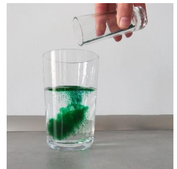
Bild 2: Lebensmittelfarbe löst sich in Wasser auf (Forscherstation)