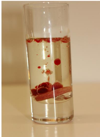
Bild 5: Wassertropfen erreichen die Brausetablette (Forscherstation)