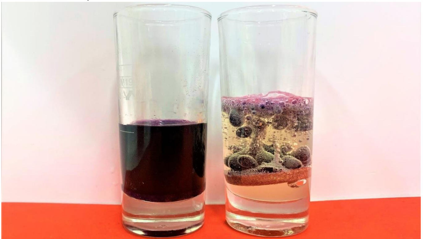
Bild 1: Glas mit gefärbten Wasser neben Glas mit Öl, Wasser und Brausetablette (Forscherstation)

Aufsteigen · absinken · Ölschicht · Gasbläschen · vermischen · Flüssigkeit · flüssig · fest · Oberfläche · vermengen · schütteln · blubbern · sprudeln · auflösen · riechen · trennen · meiden · abstoßen